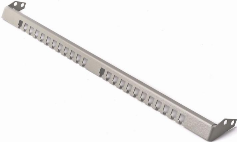
Рисунок 2. Крепление внешнего блока поддержки кабеля ESRB2-GY на стойке