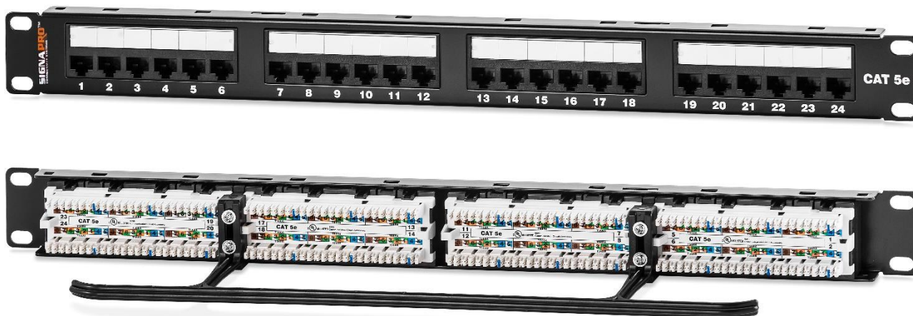
Рисунок 2. Монтажно-габаритные размеры коммутационной панели 24458ЕС-С5Е