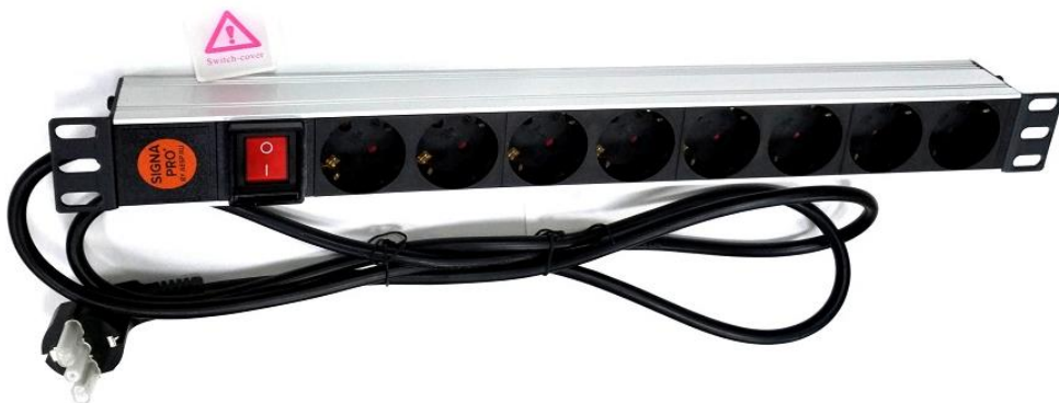
Рисунок 2. Монтажно-габаритные размеры блока розеток REC-S816