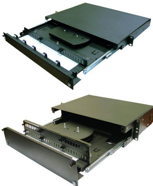
Рис.1: Коммутационные панели 1U и 2U

Новая серия REC-FOPV-8-xx включает 19-дюймовые выдвигаемые оптические коммутационные панели высотой 1 и 2U. Основное назначение продукта – коммутация оптических трасс и защита оптических сборок от механических повреждений.